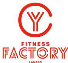
Tabela de Preços/Condições

Rua 25 Abril, Bloco 2A Quinta das Lages, Lamego