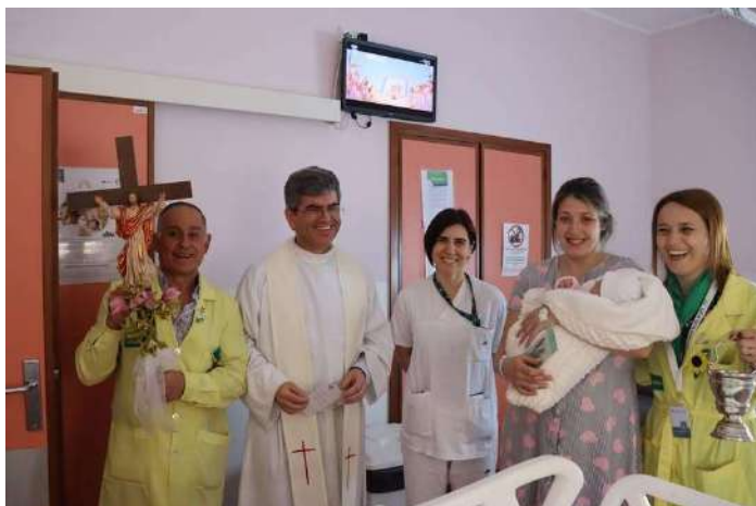
Assembleia Geral da LAHL - 21/03/2026