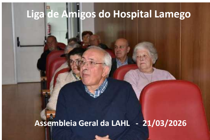
Liga de Amigos do Hospital Lamego