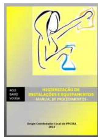
Ana Isabel Sá

Este manual, pretende ser uma ferramenta de trabalho, ao fornecer um conjunto de especificações técnicas aos profissionais de saúde para a concretização do PPCIRA, proporcionando um conjunto de padrões de referência para a execução de técnicas e de procedimentos.