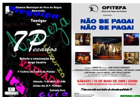
Figura 3 – O teatro foi uma das principais apostas de 2009

Em 2010 esta associação pretende reforçar esta presença.